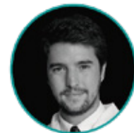
Alejandro Viena Investigación